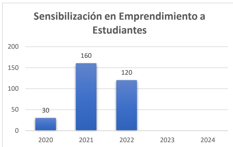
Figura1. Sensibilizaciones a estudiantes sobre emprendimiento

En la figura 39 se presenta la formación que realizó el Consultorio Administrativo a estudiantes de Administración de Empresas, logrando la formación de 23 asesores junior y 71 formuladores e investigadores sociales.