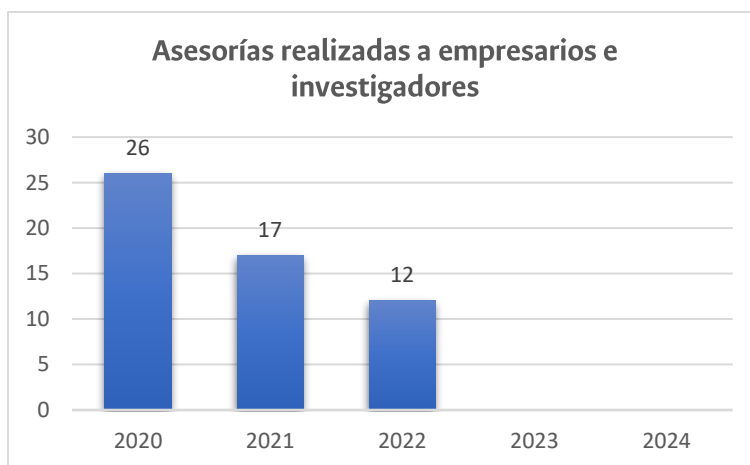
Figura 21. Asesores y formuladores e investigadores sociales capacitados

En la figura 39 se presenta la formación que realizó el Consultorio Administrativo a estudiantes de Administración de Empresas, logrando la formación de 23 asesores junior y 71 formuladores e investigadores sociales.