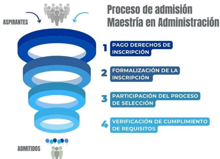
Figura 1. Proceso de Admisión, Maestría en Administración

Los requisitos particulares del proceso de admisión de la Maestría en Administración, en cualquiera de sus perfiles, están contemplados en el Acuerdo 052 de 2016 del Consejo Facultad de Administración Sede Manizales, y los principales se ilustran en la figura 14.