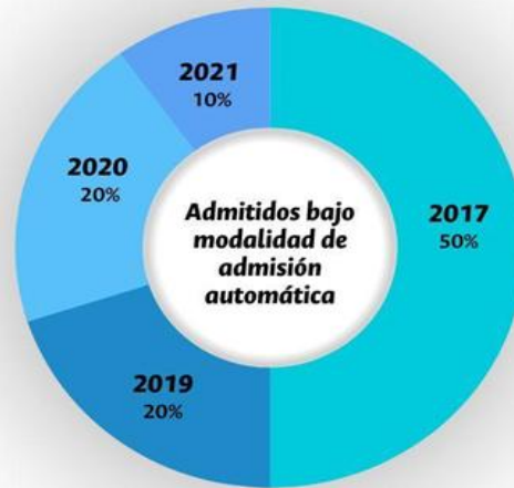
Figura 4. Admitidos bajo modalidad de admisión automática.