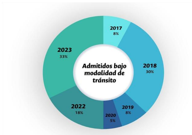
Figura 3. Admitidos bajo modalidad de tránsito.

de motivación, orientación y acompañamiento para los estudiantes de las especializaciones, logrando así, para el año 2023, 13 tránsitos matriculados: 6 en 2023-1s y 7 en 2023-2s.